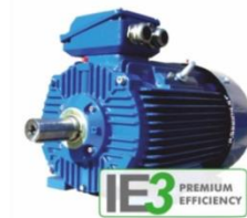
มอเตอร์ประสิทธิภาพสูง

กปภ. ได้มีการนำมอเตอร์ประสิทธิภาพสูงมาใช้งานร่วมกับเครื่องสูบน้ำในสถานีผลิต-จ่ายน้ำของ กปภ. ที่มีการเดินเครื่องเป็นเวลานาน ทำให้เห็นผลการประหยัดพลังงานไฟฟ้าได้ชัดเจน และจะประหยัดพลังงานมากขึ้นเมื่อใช้งานร่วมกับ VSD