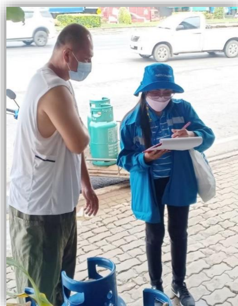
โครงการเติมใจให้กัน