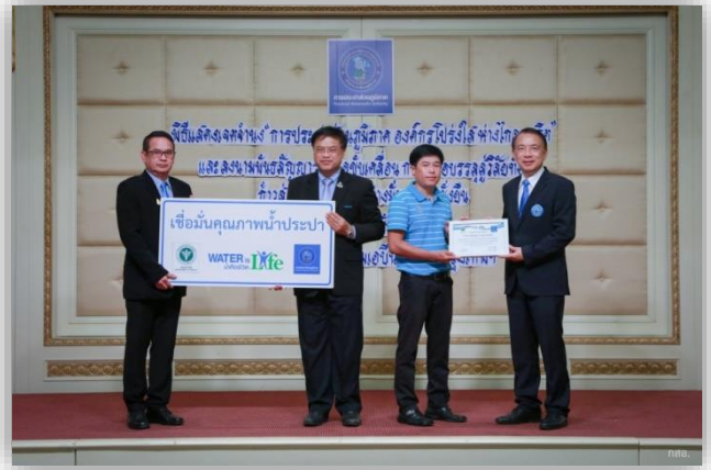
โครงการ Water is life