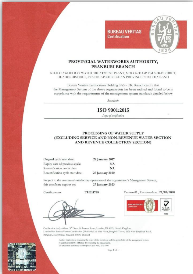
โครงการ ISO 9001