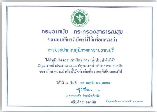
โครงการน้ำประปาดื่มได้