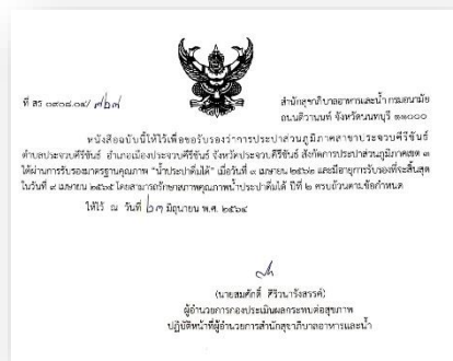
โครงการน้ำประปาดื่มได้