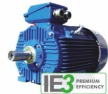
มอเตอร์ประสิทธิภาพสูง

กปภ. ได้มีการนำมอเตอร์ประสิทธิภาพสูงมาใช้งานร่วมกับเครื่องสูบน้ำในสถานีผลิต-จ่ายน้ำของ กปภ. ที่มีการเดินเครื่องเป็นเวลานาน ทำให้เห็นผลการประหยัดพลังงานไฟฟ้าได้ชัดเจน และจะประหยัดพลังงานมากขึ้นเมื่อใช้งานร่วมกับ VSD