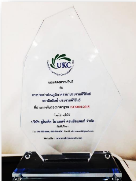
ได้รับการรับรอง ISO9001:2015

นอกจากนี้ กปภ.สาขาประจวบคีรีขันธ์ ยังมีการพัฒนาหน่วยงานอย่างสม่ำเสมอ มีการจัดทำโครงการต่างๆ เพื่อสร้างความมั่นใจในด้านคุณภาพน้ำและด้านบริการแก่ผู้บริโภค