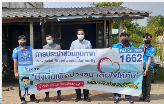
โครงการเต็มใจให้กิน