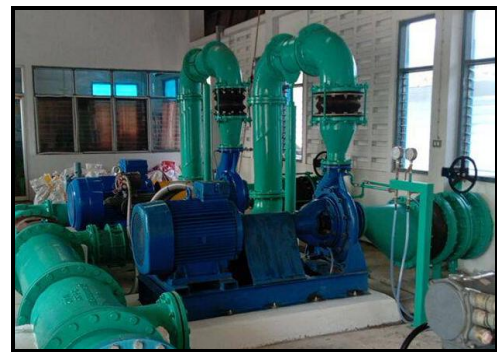
มอเตอร์ประสิทธิภาพสูง