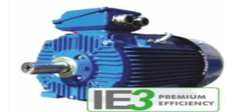
มอเตอร์ประสิทธิภาพสูง

กปภ. ได้มีการนำมอเตอร์ประสิทธิภาพสูงมาใช้งานร่วมกับเครื่องสูบน้ำในสถานีผลิต-จ่ายน้ำของ กปภ. ที่มีการเดินเครื่องเป็นเวลานาน ทำให้เห็นผลการประหยัดพลังงานไฟฟ้าได้ชัดเจน และจะประหยัดพลังงานมากขึ้นเมื่อใช้งานร่วมกับ VSD