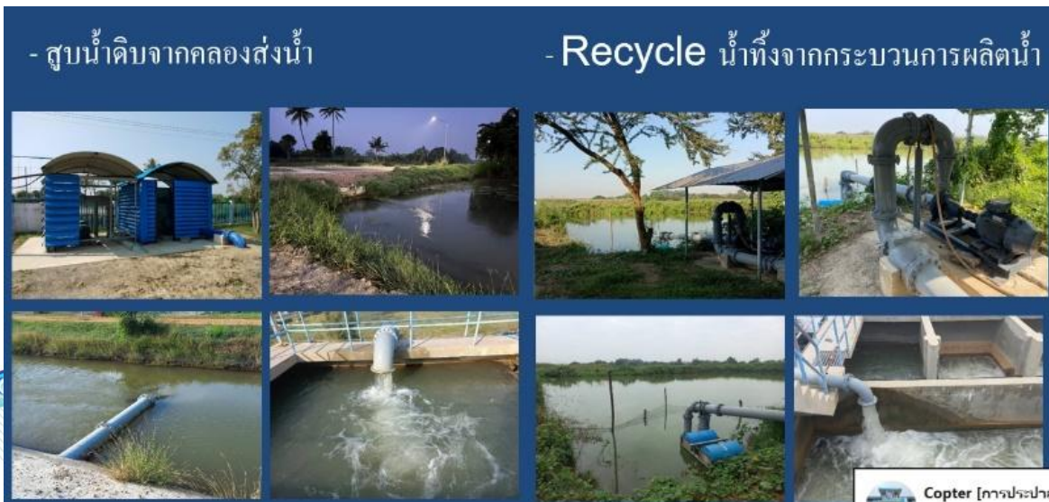
Copter [การประปา]